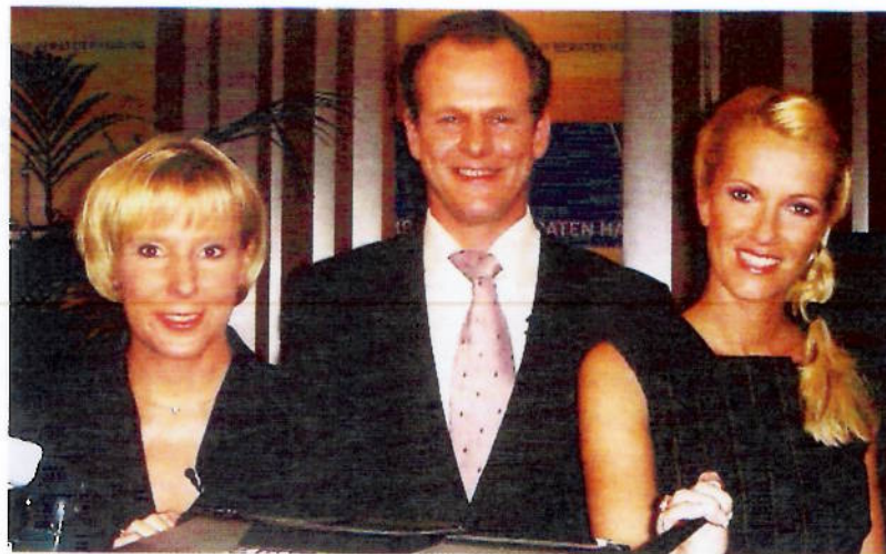
Ein Trio auf Erfolgskurs: Die ersten TV-Banker Deutschlands bei der Sparda-Bank Hamburg.